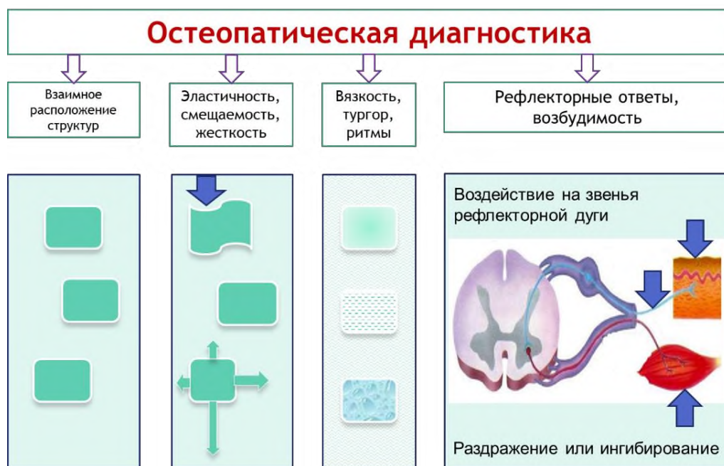
Рисунок 4. Нарушения, выявляемые при остеопатической диагностике

Восстановление подвижности приводит к нормализации функционального состояния тканей и является целью применения остеопатических лечебных техник.