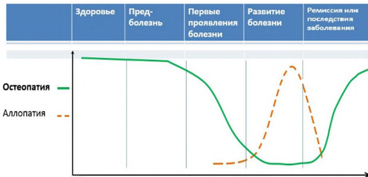
Рисунок 7. Место остеопатии в системе оказания медицинской помощи населению.

ОК может применяться до, совместно или после фармакологического или хирургического лечения и усиливать терапевтический эффект, значительно сокращая при этом период реабилитации пациента и риск возникновения осложнений. Важным результатом ОК является уменьшение лекарственной нагрузки на организм пациента, а, следовательно,