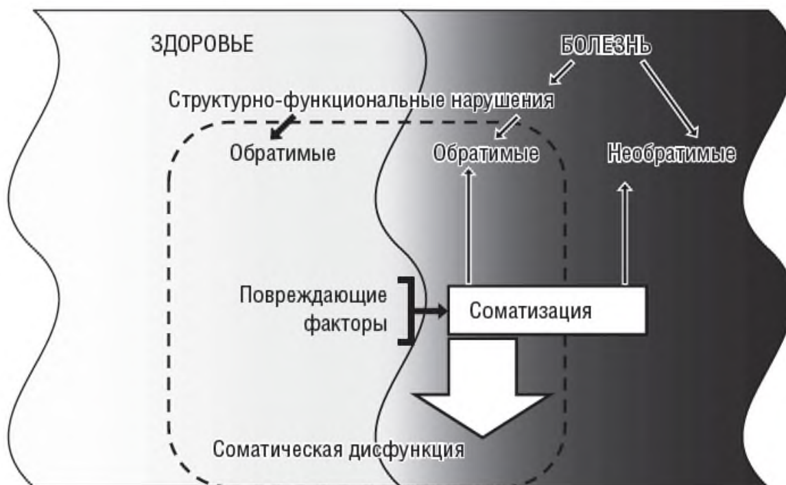
Рисунок 1. Взаимоотношение понятий «здоровье», «болезнь» и «соматическая дисфункция».

В соматической дисфункции можно выделить 3 основных компонента: биомеханический, гидродинамический и нейродинамический. Эти три составляющие объединяют все органы и подсистемы организма в единую целостную систему.